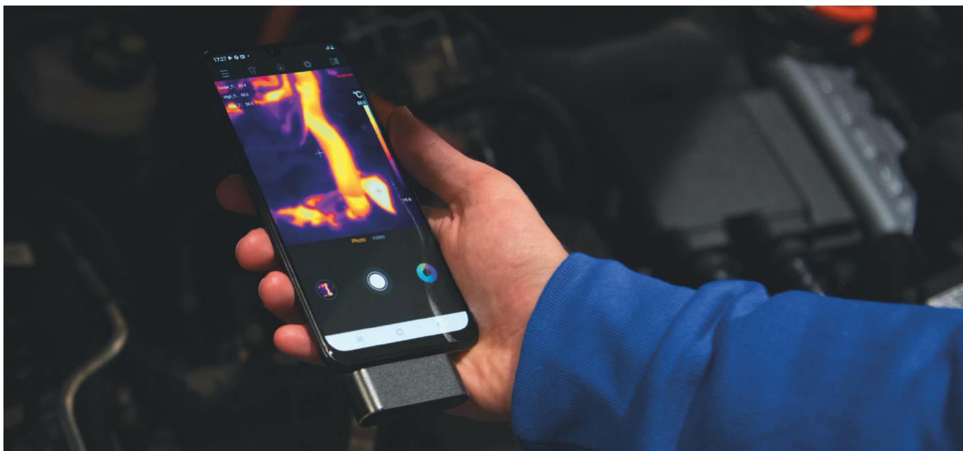
THT8 kamera csatlakoztatása mobil eszközhöz