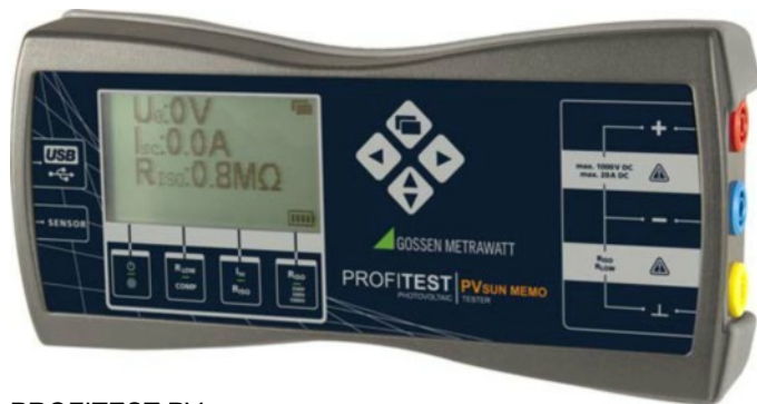
PROFITEST PVSUN MEMO