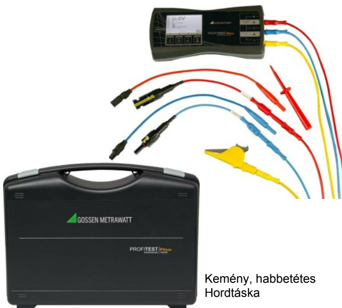
Kemény, habbetétes Hordtáska