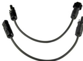
PV adapter készlet SUNCLIX-MC4 (Z360H)