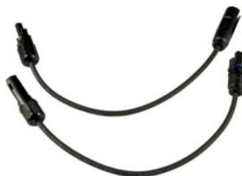
PV adapter készlet TYCO-MC4 (Z360J)

Mágneses mérőcsúcsok (szabadalom) (patent) mágneses rögzítővel (Z502Y)