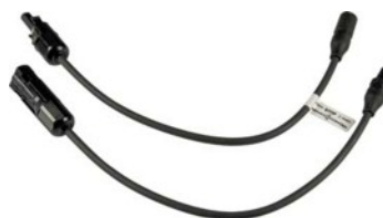
PV adapter készlet MC3-MC4 (Z360K)