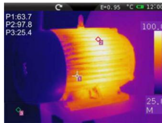
Max. 3 mérési pont (spot)

A THT47 egy hatékonyan használható, felhasználóbarát hőkamera, amely jól használható részletes hőeloszlás analízisre. A készülék a nagy fényerővel rendelkező, színes, TFT érintőképernyőn megjelenő menürendszerrel kezelhető. Az elkészült hő- és valódi képeket a készülék mikro SD memóriakártyára, jpeg formátumban menti el. Az elmentett képek USB interfész segítségével tölthetők át PC-re. A készülékkel valódi IR videó is készíthető. A THT47 optimális felbontású (160*120 képpont) IR érzékelője igen jó szolgálatot tesz megelőző karbantartások kidolgozásánál az ipar szinte minden területén. A nagy méréstartomány (max 400°C), valamint a számos beépített funkció, mint pl. a pont, vonal, területi és izotermál analízis alkalmazása az egyes képekre, a készüléket hatékonyságát nagy mértékben növelik, ideális eszközzé téve a készüléket mechanikai és elektromos hibák felderítésére, hidraulikus és szellőztető rendszerek ellenőrzésére, stb.