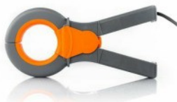
HT97U: Szivárgóárammérő AC lakatfogó