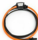
4 db. HTFlex33E: flexibilis lakatfogó