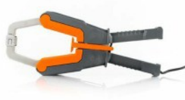
HP30C2: AC lakatfogó