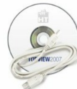
TOPVIEW2007: PC szoftver + USB kábel