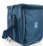
BORSA2051: Puha hordtáska