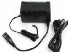
A0055: külső adapter 230 V 50/60 Hz, 5VDC - 1.5A