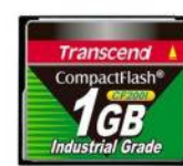
CF800: CompactFlash memória kártya