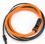
HTFLEX35: Flexibilis AC alaktfogó