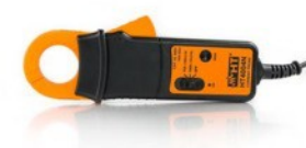
HT4004N: DC lakatfogó