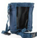
SP0400: Puha hordtáska