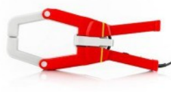
HP30D1: DC lakatfogó