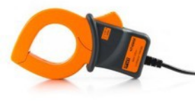
HT4005K: AC lakatfogó