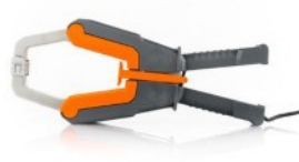
HP30C3: AC lakatfogó