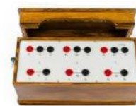
HT903: Lakatfogó csatoló egység