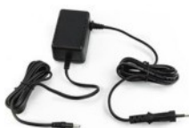
Tápegység/teleptöltő CAT IV