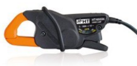
HT4005N: AC lakatfogó