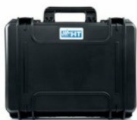
VA500 kemény hordtáska