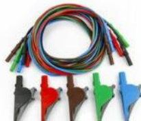
KIT800: 5 mérőkábel krokodil csipeszekkel